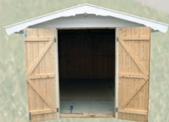
Redskapsbod 4 m 2 , 7 m 2 og 10 m 2

"Kjøp en bod og få bilen tilbake i garasjen". Et uttrykk mange av oss vil kjenne oss igjen i. Her er løsningen for deg med stort lagerbehov! Vår romslige bod har dobbeltdører som gjør det lett å få inn og ut sykler, gressklippere, hageredskaper og lignende. Boden leveres med stående panel. Ett av vegg- elementene har et vindu som kan plasseres valgfritt. Et stabilt gulv er selvfølgelig med. Bodene leveres med ferdig tilkappede materialer og er lette å montere.